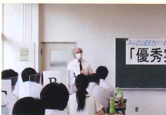
優秀実践に学ぶ会(8月)