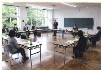
茨城大会準備委員会(11月)