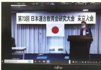
日連教東京大会オンライン(8月)